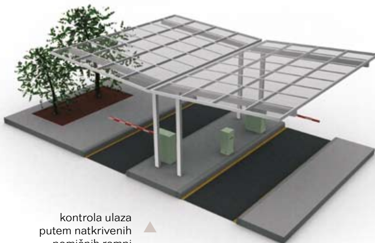
kontrola ulaza putem natkrivenih pomičnih rampi ▲