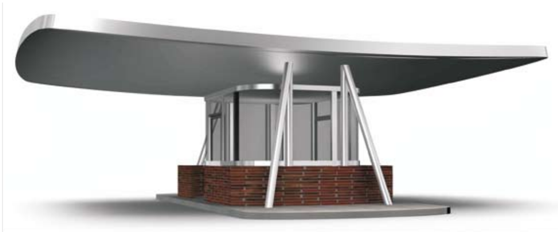
portirnica sa nadstrešnicom ▲

kontrolno mjesto za mornara razvijano za potrebe Marine Puna: inox konstrukcija, fasada od laminata u boji drva, tenda, inox ograda, stubište, osmatračnica ▼