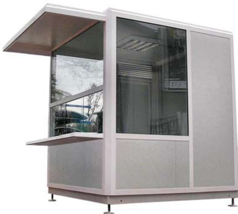
▲ portirnica dimenzija 2,4 x 2,4 m, sa nadstrešnicom i pultom alumijska konstrukcija