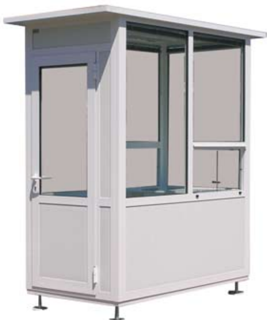
▲ portirnica dimenzija 1,2 x 2,2 m alumijska konstrukcija

Kućice za naplatu ili kontrolu, portirnice odnosno biljetarnice radimo u nekoliko osnovnih modela koji se razlikuju dimenzijama, materijalom izrade i opremom.